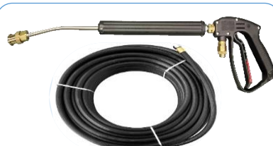
洗浄ガン・ホース5M