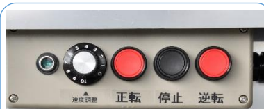
速度調整ダイヤル 正逆転スイッチ