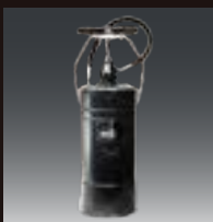
水槽付手押しポンプ消化器